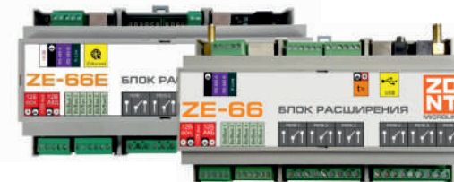
Блоки расширения ZE-66 / ZE-66E

- 4 термодатчика - блок питания - антенна GSM - антенна радио - кабель USB - SIM-карта